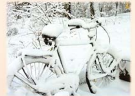
Завжди потрібно цінувати прогнози експертів. Вони можуть стати для нас вирішальними