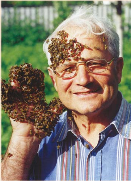
Фото тата на пасіці, зроблене мною декілька років тому. Він також є знавцем столярної справи, мануальної терапії, поезії, філософії, педагогіки та музики.

Ц я фотокартка нагадує нам про існування особливих знань. Фантастично налагоджені комунікації між сотнями кусючих істот та тим, хто, по-суті справи, відбирає у них мед – пасічником, говорять про одне: "Знання – сила!".