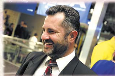
Майстер-клас створено після навчання тренера у Його Святості Далай-Лами