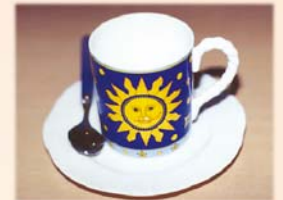
Традиційно, горнятко наповнюють чаєм або кавою. Але саме цю чашку хочеться наповнити чимось особливим, чи не так? Отже, станьмо особливими, і нам захочеться наповнювати своє подальше життя чимось відмінним від рутини і по-справжньому цікавим!